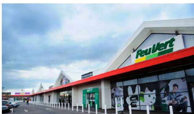
ISTROMED - Istres