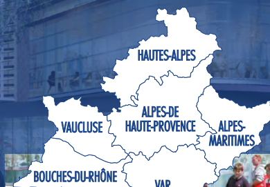
PLACE MORGAN - Salon-de-Provence