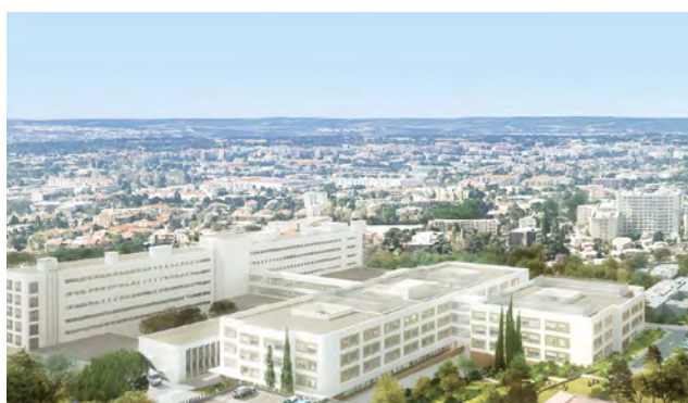
CENTRE HOSPITALIER INTERCOMMUNAL AIX-PERTUIS - Aix-en-Provence