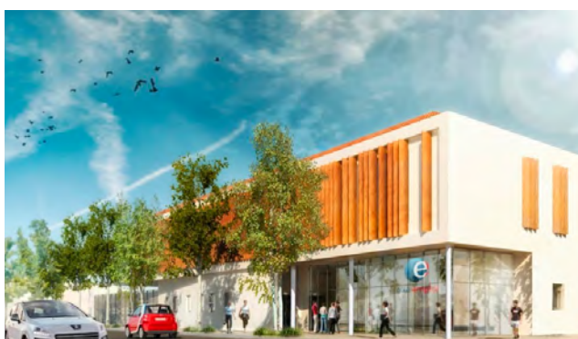
PÔLE EMPLOI - Carpentras