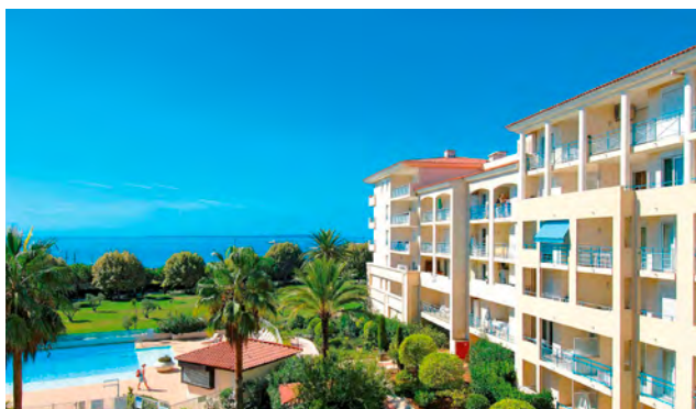
LES PINS BLEUS - Juan-les-Pins