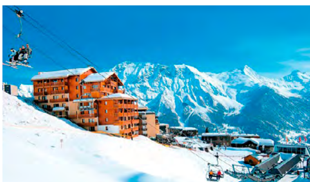
LES TERRASSES DE LA BERGERIE - Orcières Merlette