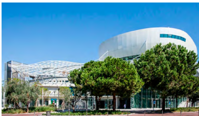
PALAIS DES CONGRÈS d'Antibes Juan-les-Pins