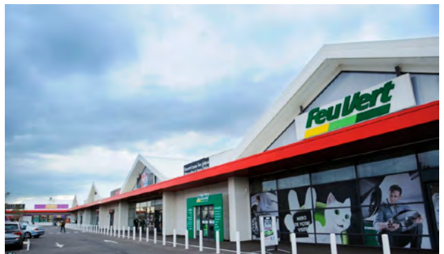
ISTROMED - Istres