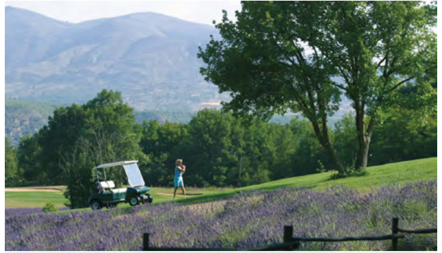
GARDEN GOLF - Digne-les-Bains