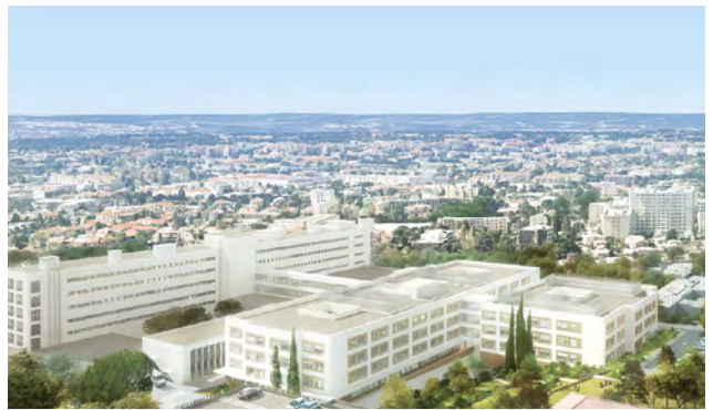
CENTRE HOSPITALIER INTERCOMMUNAL AIX-PERTUIS - Aix-en-Provence