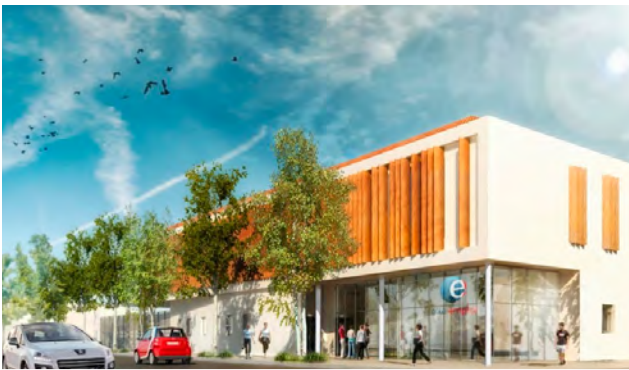
PÔLE EMPLOI - Carpentras