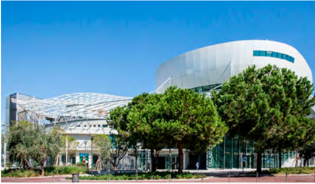
PALAIS DES CONGRÈS d'Antibes Juan-les-Pins